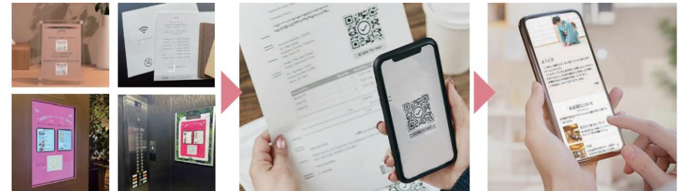
お客様の目につく場所に QR掲示