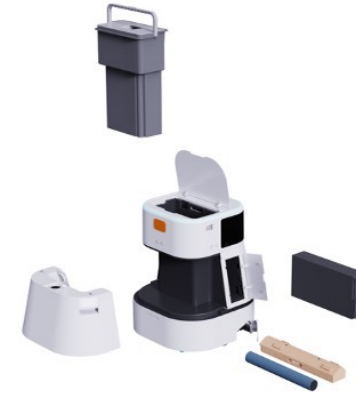
簡単なメンテナンス 日常的なメンテナンス、修理・アップグレード、運用管理を容易にします。