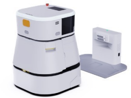
自動充電機能 掃除完了後、自動的に充電ステーションに戻ります。