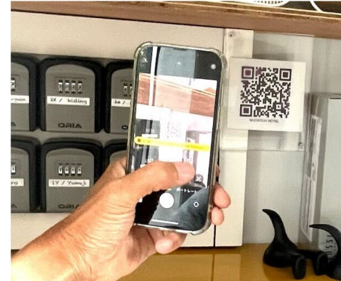
実際のチェックインシーン(所要時間:約20秒)